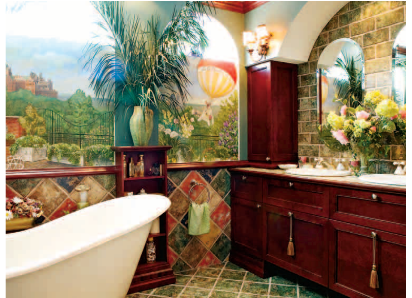
Élégance et couleurs dans la salle de bains rétro dont l'intérêt principal est le trompe-l'œil représentant la terrasse du toit et sa vue. Un invité de marque : Schatzi atterrissant en montgolfière. Aménagement : Yves Marcoux.

vitalité et la joie. C'est dans les salons de Paris qu'elle avait noté l'effet puissant du rouge sur la réussite des soirées. Ne dit-on pas du rouge qu'il stimule les sens et met en appétit ? « Le blanc, le monochrome, c'est parfait chez les autres, mais pas chez moi. Je me sens, bien entourée de couleurs qui flattent le teint et embellissent mes invités sous la lumière des bougies », dit-elle.