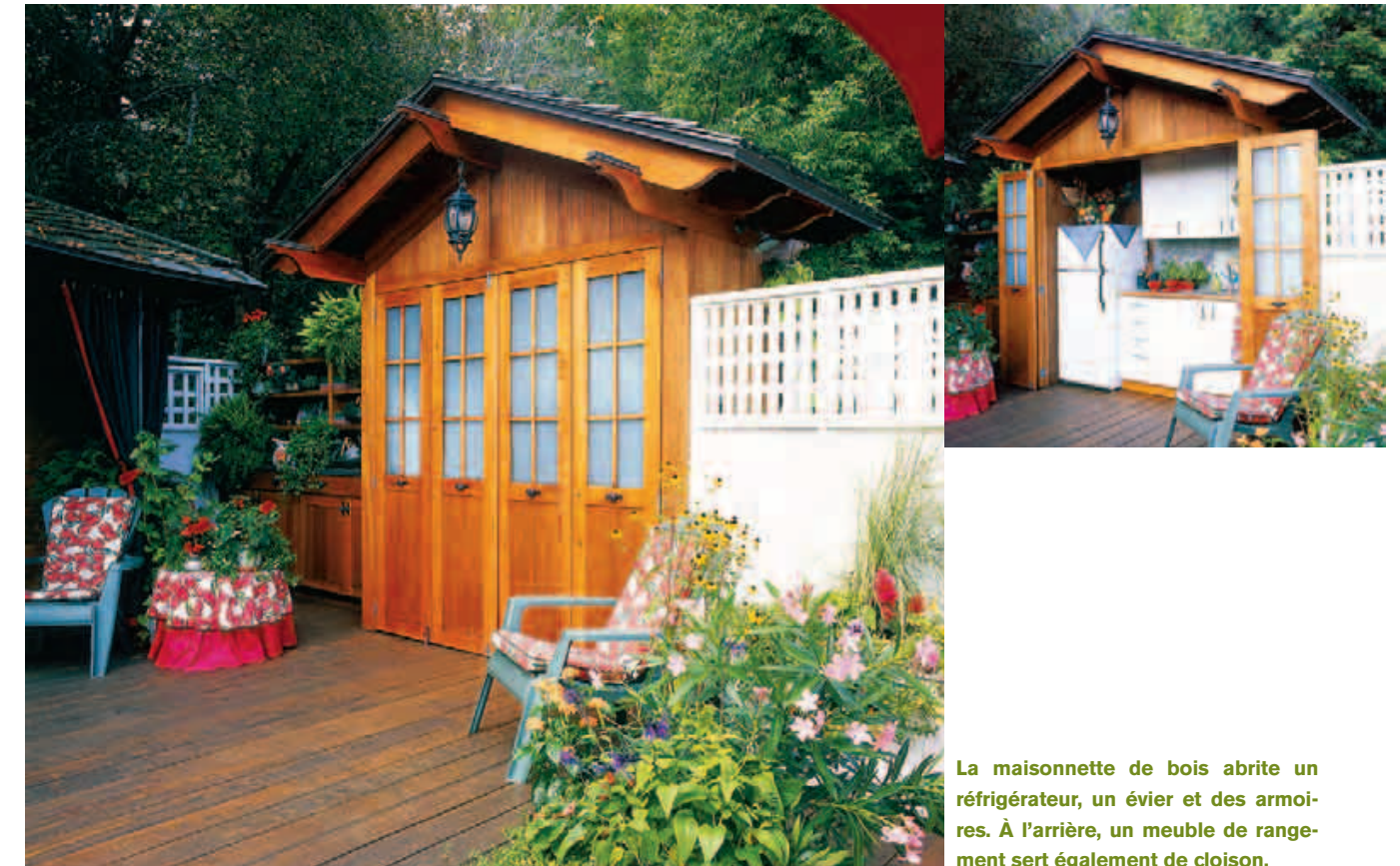
La maisonnette de bois abrite un réfrigérateur, un évier et des armoires. À l'arrière, un meuble de rangement sert également de cloison.

marque la maison. Il veut surtout y retrouver les commodités et le confort des pièces à vivre afin d'éviter les allers-retours entre la terrasse et la demeure. On imagine donc deux maisonnettes. L'une pourvue d'une avancée abrite le coin repas en toute intimité. La seconde dissimule une cuisine parfaitement équipée. L'hiver venu, les deux constructions servent à ranger le mobilier, les jardinières, le linge de table et la vaisselle.