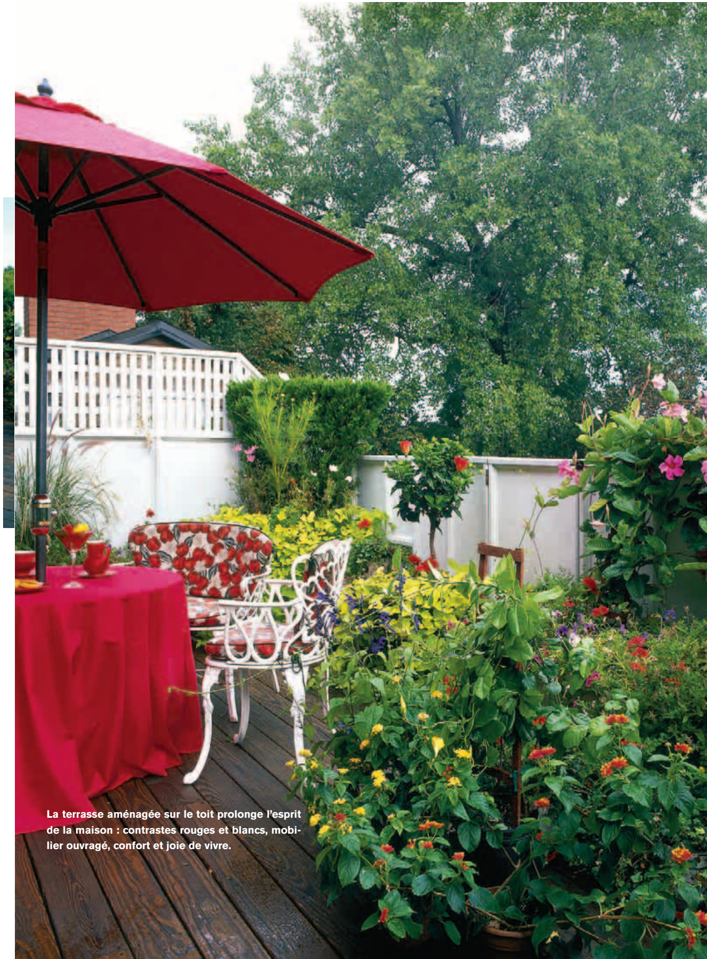
La terrasse aménagée sur le toit prolonge l'esprit de la maison : contrastes rouges et blancs, mobilier ouvragé, confort et joie de vivre.