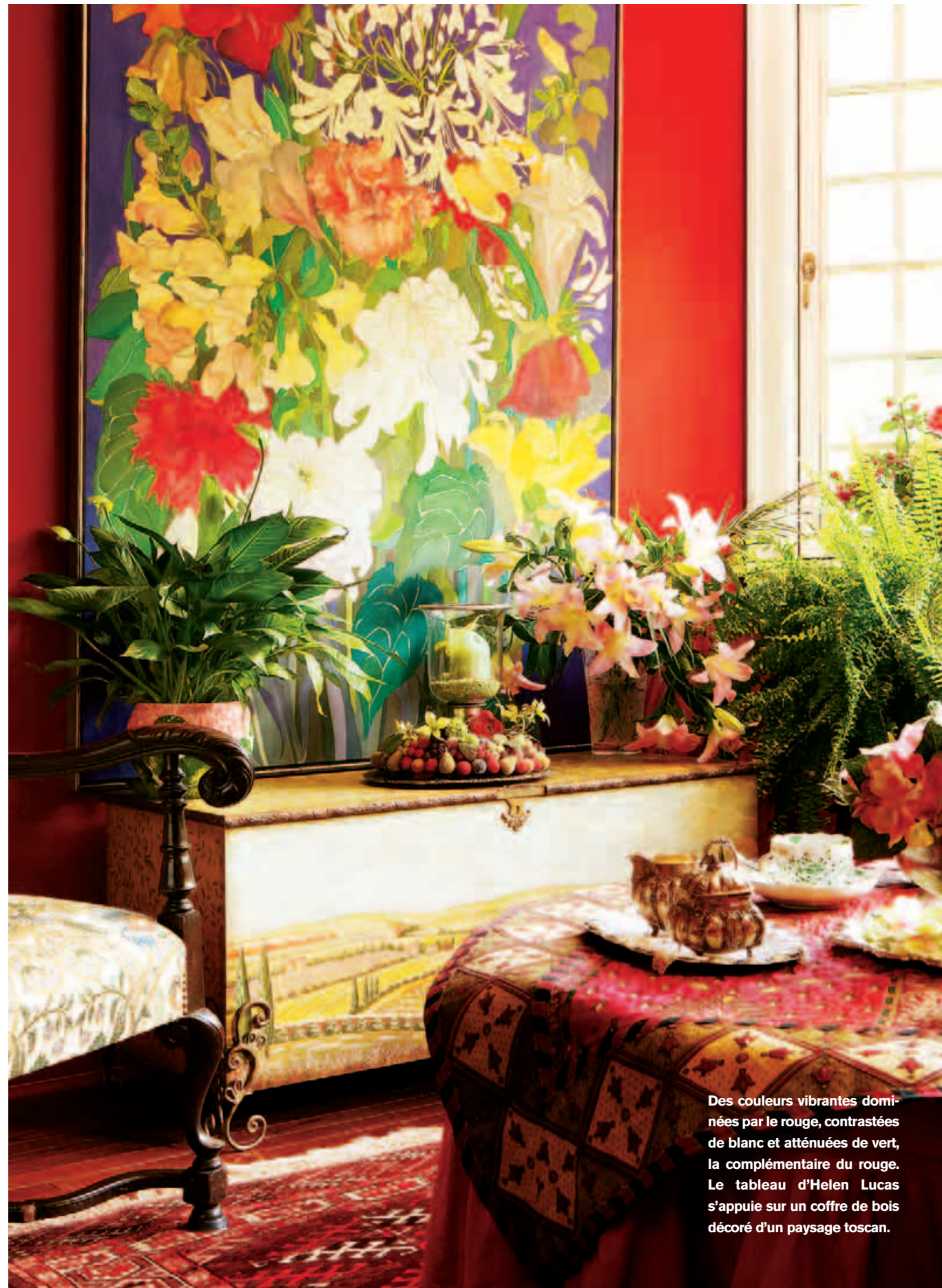
Des couleurs vibrantes dominées par le rouge, contrastées de blanc et atténuées de vert, la complémentaire du rouge. Le tableau d'Helen Lucas s'appuie sur un coffre de bois décoré d'un paysage toscan.